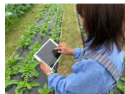
自分たちで写真を撮ったり、キャッチコピーを考えてジモノミッケのデモ画面に入力