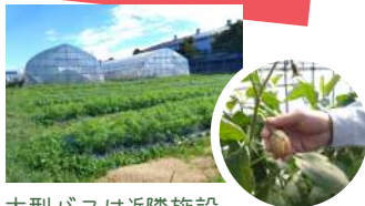
大型バスは近隣施設に駐車可能。路線バスは「小見別」停留所下車徒歩7分。

会津若松駅から車で約15分の農場で、季節に応じた野菜の収穫体験ができます。生産者と飲食店などをつなぐ需給マッチングサービス「ジモノミッケ」を疑似体験し、モノの流通や持続可能な農業を一連の流れで学びます。ハウス野菜と露地野菜があるので雨の日でも安心です。野菜はお土産に持ち帰ることも可能です。