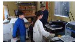
体験会の様子(動画)