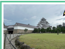
いつもの鶴ヶ城も…